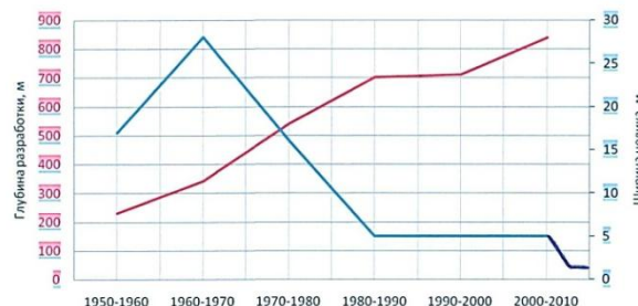
Рис. 2. Зависимость ширины целика от глубины ведения горных работ и годов разработки.

Оптимальная ширина целика для охраны выемочных штреков определялась до 80-х годов опытным путем. Она колебалась от 57м до 6м. Зависимость ширины целика от глубины ведения горных работ и годов разработки отображена на графике (рис. 2).