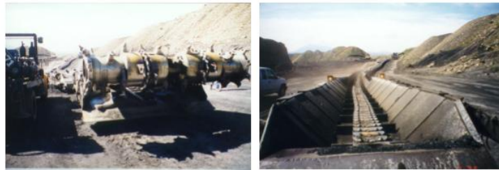
Рис. 4. Скребок система Archveyor

Система Highwall (МП) може виймати отвори прямокутної форми довжиною до 350 м і більше, а розмір отвору залежить від характеристик комплексу. Міцність гірських порід, які здатен розробляти комплекс становить f=3,8...7 . При видобутку здійснюється повний автоматизований контроль системи та гірського масиву (покрівлі і підшви) за допомогою передових технологій навігації: пасивного гамма детектора, інклінометрів, лазерного гіроскопа (RLG) і логічного контролера (PLC).