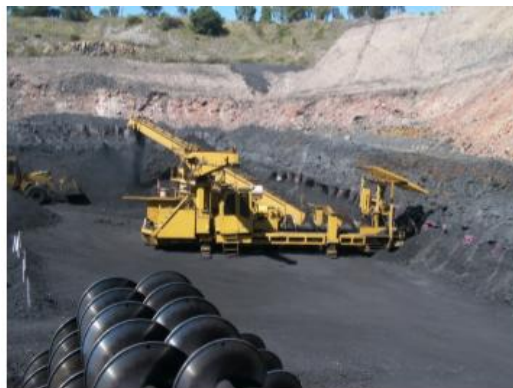
Рис. 5. Шнекова система

Шнекова система Highwall в загалом покращила видобуток корисних копалин у зв'язку з її безпечністю і продуктивністю. Тим не менш, її застосування обмежене умовами залягання, параметрами та властивостями пластів: кут падіння (не більше 16-25^\circ ), потужність, кривизна, тріщинуватість, наявність розломів і вигинів та ін.