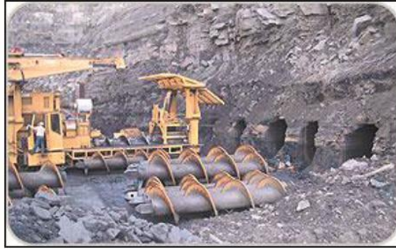
Рис. 6. Шнекова гірничча система.

Досвід застосування систем Highwall на кар'єрах світу, лабораторні дослідження та чисельне моделювання закордонних вчених показують, що шнекові гірничовидобувні системи (Metec highwall mining system) забезпечують більшу стабільність гірничих виробок та стійкість відробленого борта кар'єра ніж системи виймання з безперервним робочим органом.