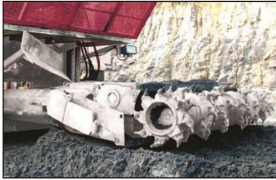
Рис. 2. Безперервний робочий орган.