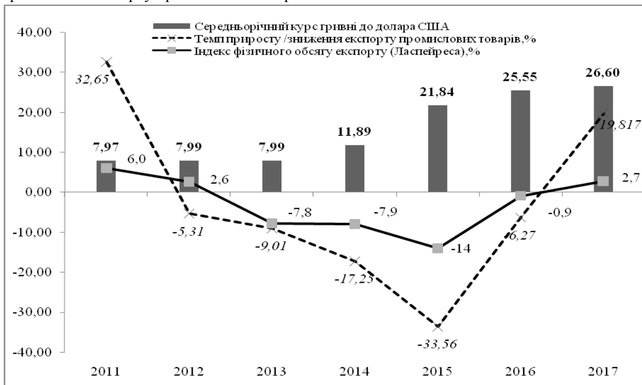
Рис. 2. Динаміка показників експорту промислової продукції в Україні

зовнішніх товарних ринках. Це, своєю чергою, є наслідком сировинної орієнтації українського експорту промислових товарів.