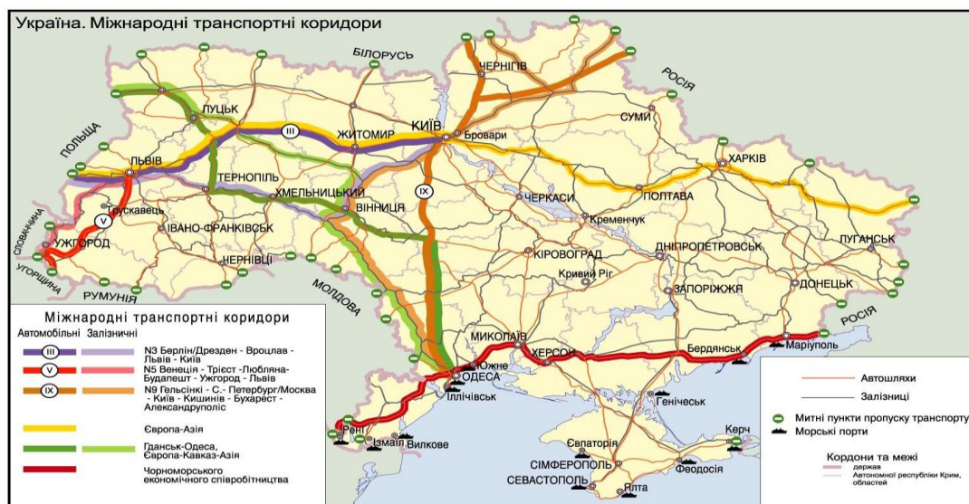
Рис. 2. Карта міжнародних транспортних коридорів України

Важливо зазначити, що Одеська область розташована на шляху інтенсивних міжнародних транспортних коридорів, що визначає її значний транспортно-транзитний потенціал (рис 2).