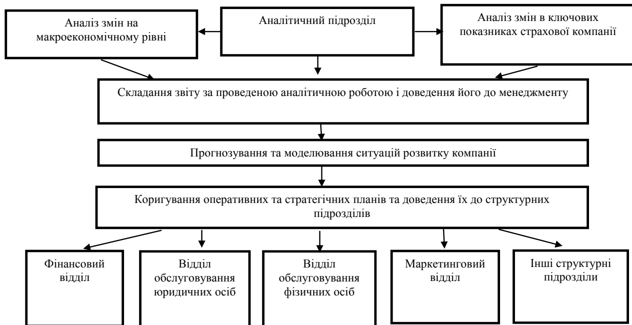
Рис. 2. Процес антикризового управління страховою компанією

В умовах фінансової та економічної кризи кожна страхова компанія має адекватно реагувати на негативні зміни, що відбуваються як в сфері споживчого попиту на страхові послуги, так і в сфері формування капіталу та розміщення власних коштів і коштів страхових резервів. Реакція менеджменту страховика на негативні зміни має бути швидкою. Запізнення в прийнятті тих чи інших антикризових рішень часто викликає додаткові збитки.