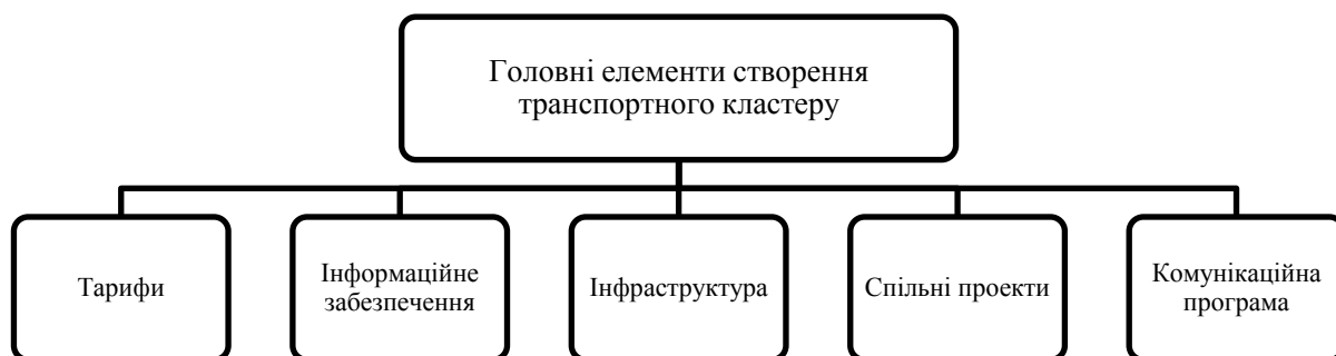
Рис. 2. Головні елементи створення транспортного кластеру

На сьогоднішній день основними перспективними центрами розвитку міжнародної транспортної інфраструктури є надпотужні морські порти Одеського узбережжя (насамперед Одеський, Чорноморський та Южний Морські торгові порти). Перший етап створення транспортного кластеру в вже пройдено – прийнято законодавче рішення про його створення та визначено базове підприємство (Одеський морський торговельний порт) – то постає необхідність в подальших кроках (рис.2).