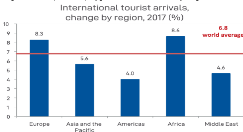
Рис. 2. Структура міжнародного туризму за регіонами світу у 2017 році

Згідно з прогнозом Всесвітньої організації туризму (СОТ) (UNWTO) Європа як регіон виїзного туризму має хорошу базу зростання за всіма напрямками, за винятком Південній Азії. Однак зростання виїзного туризму з Європи і Середземномор'я помітно сповільниться, тоді як