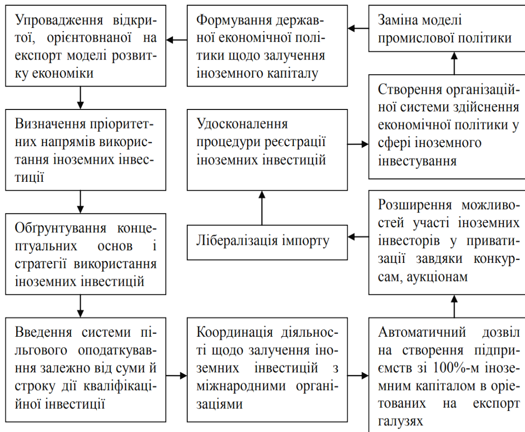
Рис.1 Економіко-організаційний блок механізму ПІІ в Одеський регіон

Значимим чинником с механізму притягування прямих іноземних інвестицій в Одеський регіон є його економіко-організаційний блок.