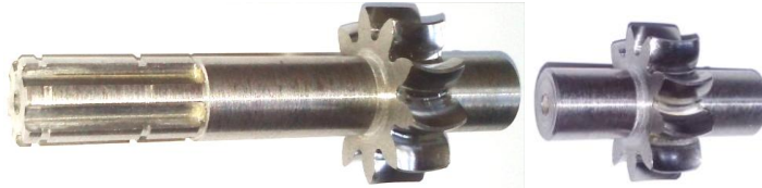
Рис. 3. Експериментальна пара зубчастих коліс з арочною формою зуба

Для прикладу, для заміни зачеплення насосу НШ10 було розраховано та виготовлено експериментальну пару зубчастих коліс з арочною формою зуба з наступними параметрами: m = 3 , z = 10 , x = +0,355 (рис. 3).