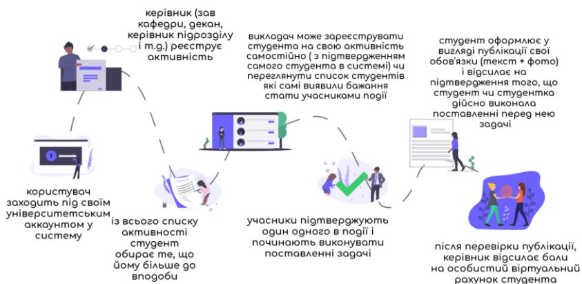
Рис. 1. Схема роботи віртуальної валюти в навчальному закладі

На рисунку 1 можна побачити загальну схему основних етапів обліку віртуальної валюти університету.