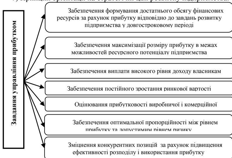
Рис. 1. Завдання управління прибутком

7) Принцип орієнтації на стратегічні цілі розвитку підприємства.