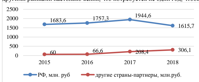
Рисунок 1 - экспорт молочной продукции в РФ и другие страны-партнеры Беларуси.

Можно отметить увеличение экспорта РБ со странами партнерами, кроме РФ, что говорит о плодотворной работе по поиску новых рынков сбыта и реализации молочной продукции государством. Но разрыв между РФ и другими рынками настолько велик, что потребует не один год, чтобы сократить его.