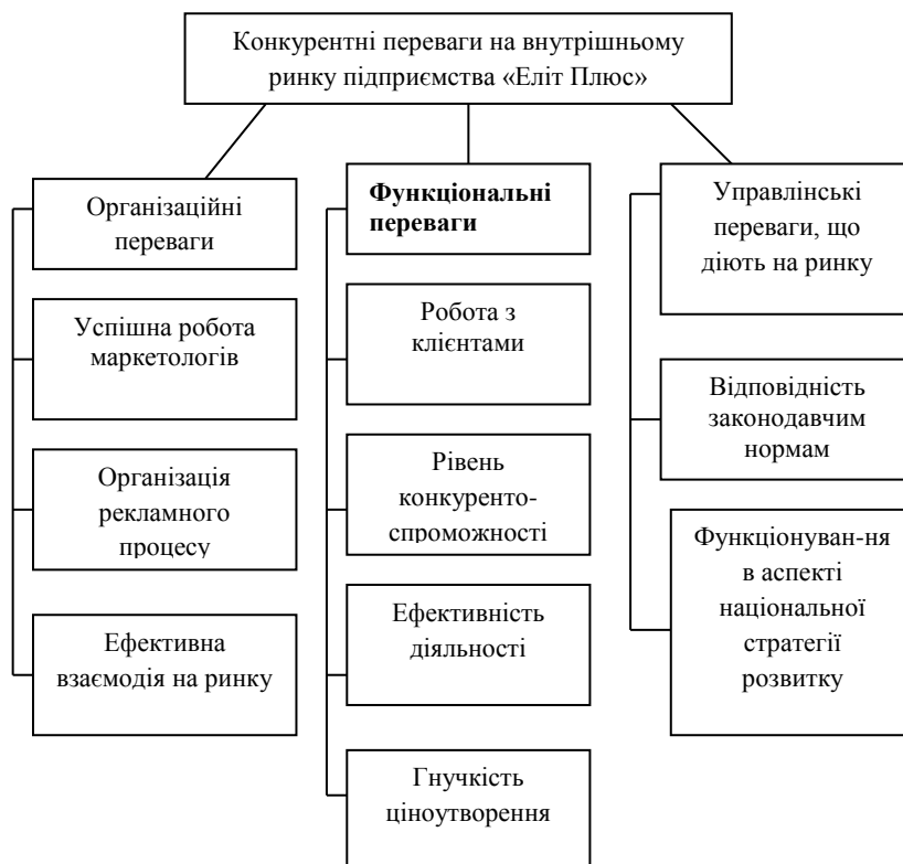
Рис. 2. Конкурентні переваги торговельного підприємства

Зазначена методика була використана при аналізі діяльності підприємства ТОВ «Еліт Плюс», метою якого є одержання прибутку шляхом здійснення комерційної та іншої господарської діяльності. При чому акцент зроблено на конкурентні переваги торговельного підприємства. Для обраного підприємства, було підібрано декілька параметрів, які характерні безпосередньо для нього на внутрішньому ринку, до яких відносяться: організаційні, функціональні та управлінські (рис. 2).