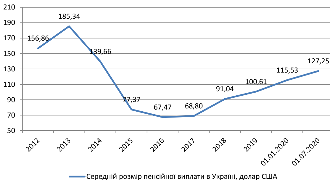
Рис.2. Динаміка середнього розміру пенсійної виплати в Україні у доларах США за 2012-2020 рр.

Проте за період 2012-2020 рр. гривня зазнала девальвації. Тому дослідимо динаміку зміни розміру пенсії в Україні в еквіваленті більш стійкої валюти – долар США, яка є основною резервною та найпоширенішою валютою у світі. Побудуємо графік динаміки середнього розміру пенсійної виплати за період 2012-2020 рр. у доларах США (рис.2).