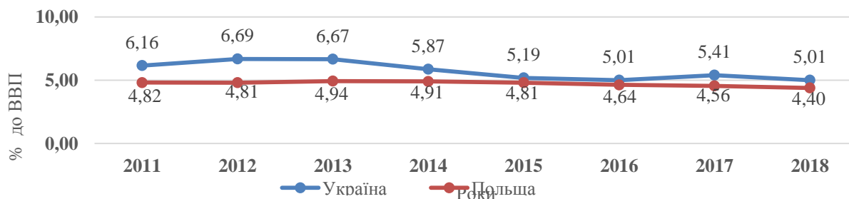
Рис. 1. Динаміка фінансування освіти (у % до ВВП) України в порівнянні з Польщею за 2011-2018 рр.

Порівняємо фінансування освіти протягом 2011-2018 рр. в Україні та Польщі.