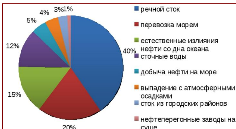
Рис. 1. Статистика источников нефтезагрязнения Мирового океана

Выбросы CO 2 в результате сжигания ископаемых видов топлива в энергетике и промышленности, которые преобладают в общем объеме выбросов парниковых газов, в 2018 г. выросли на 2,0%, достигнув рекордных 37,5 гигатонн CO 2 в год.