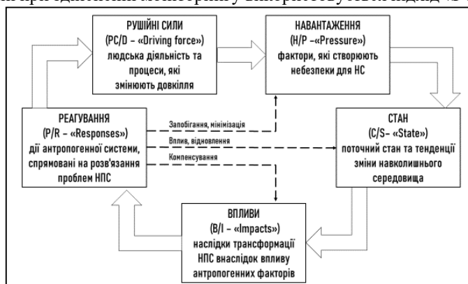
Рис. 2 – Схема підходу «РЧНСВР» («DPSIR»)

Варто відзначити, що незважаючи на різні головні завдання екологічного моніторингу, у вищенаведених країнах та зокрема в Україні при здійсненні моніторингу використовується підхід «РЧНСВР» («DPSIR») (рис. 2).