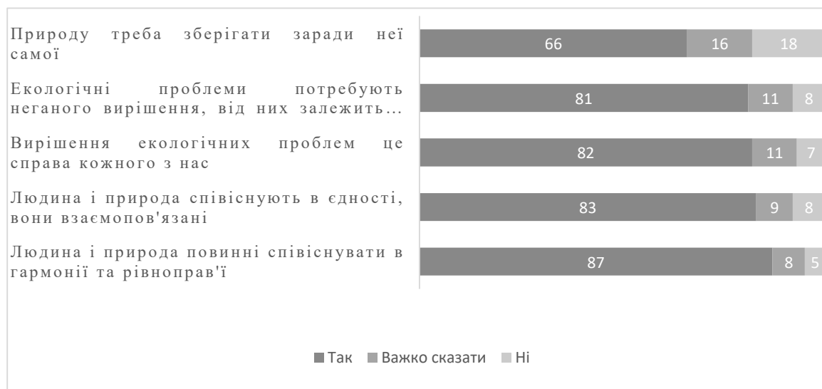
Рис. 1. Ставлення населення України до природи й екологічних проблем, 2019 рік. [2]

Кілька років тому Україна обрала напрямок розвитку у сторону європейських стандартів життя. Для того аби зрозуміти, як українці відносяться до екологічної свідомості компанія Kantar провела моніторинг цінностей, розпочавши його з опитування, результати якого представлені на рис. 1.