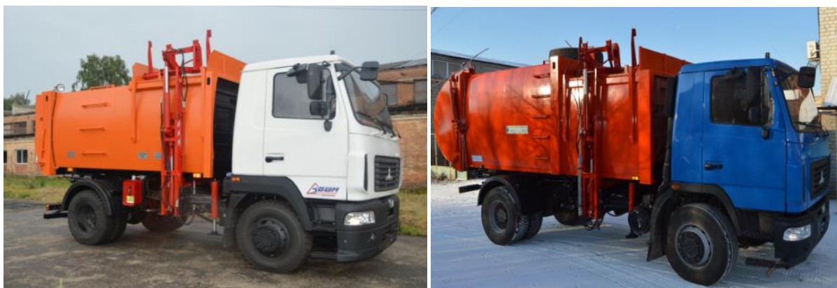
а) б) Рис. 1 – Сміттєвози КО-431-03 (а) та КО 426 (б) з боковим завантаженням

Сміттєвози розрізняються також за типом контейнера: відкриті і закриті. Обидва види, якщо не доукомплектовані додатковим обладнанням, завантажуються вручну. Подальше транспортування вантажу відбувається звичайним способом.