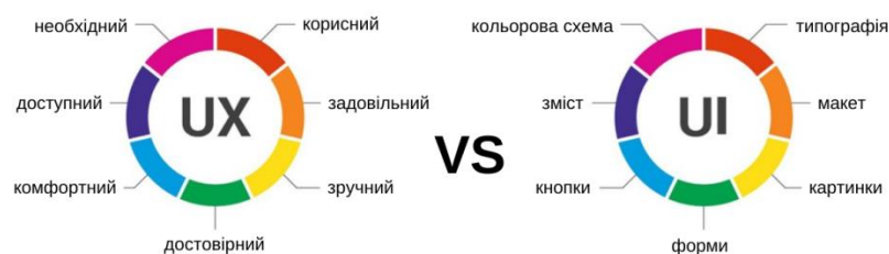
Рис. 3. Порівняння UI/UX дизайнів

Високий рівень – деталі. Ще одна відмінність між дизайнерами UI та UX – це рівень деталізації їхньої роботи. Розробники UI працюють над окремими сторінками, кнопками та взаємодіями; переконавшись, що вони відполіровані та функціональні. Розробники UX розглядають продукт або послугу на більш високому рівні, забезпечуючи повну реалізованість і узгодженість колективного потоку користувачів сайту, служби чи програми.