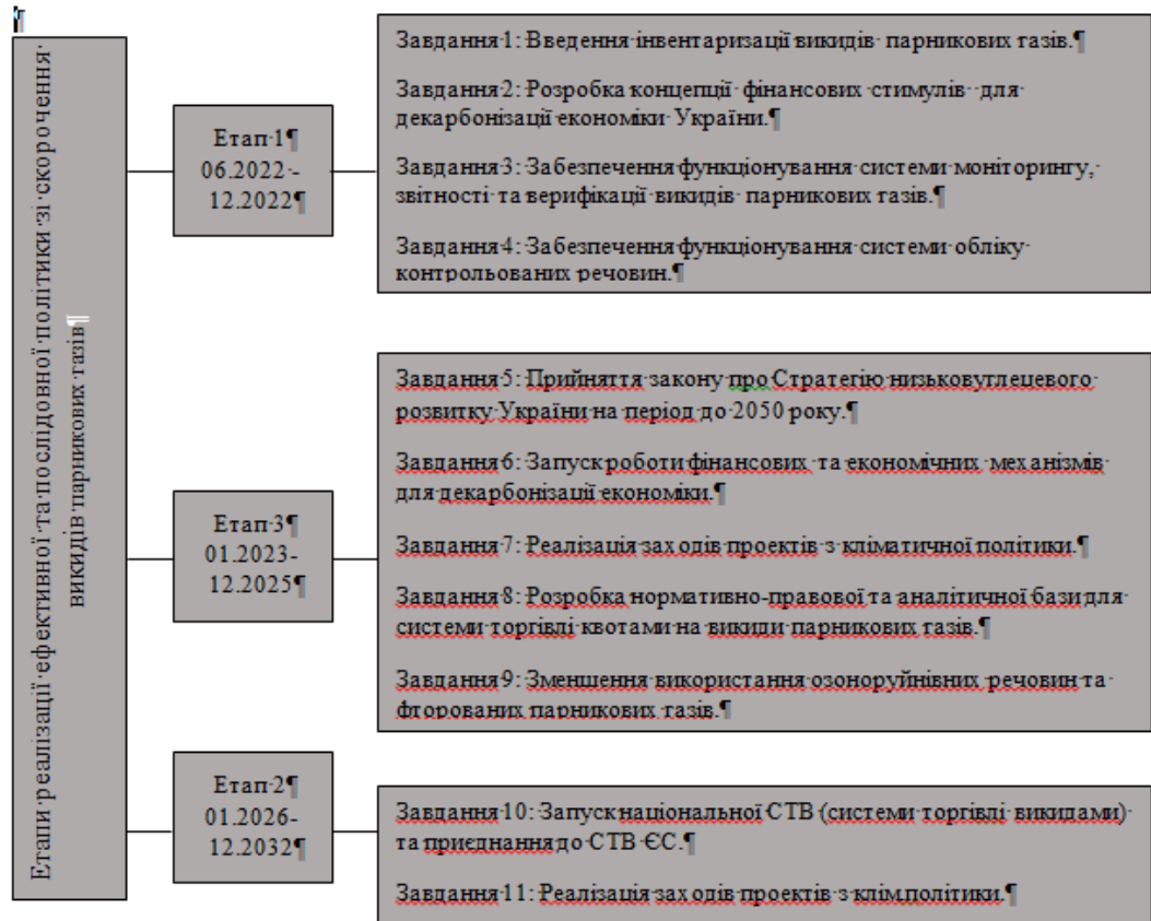
Рисунок 2: Етапи реалізації ефективною та послідовною політики зі скорочення викидів парникових газів в Україні 2022-2032 рік. [2]

Російська агресія на території України призводить до негативних наслідків для довкілля, забруднення ґрунтів, вод та повітря, знищення біорізноманіття та руйнування екосистем. Від російської агресії потерпає не лише Україна, а весь світ, негативний вплив на клімат, зумовлений значними викидами парникових газів. Отже, весь світ має долучитись до підтримки України, вплинути на якнайскоріше закінчення геноциду українського народу та всього живого на планеті. Оскільки Україна буде змушена фокусувати увагу на збільшенні мілітаризації економіки та суспільства замість впровадження "зелених" трансформацій, що несе згубний вплив на клімат, який стосується кожного життя у світі