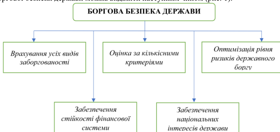
Рис. 1. Сутнісні характеристики поняття «боргова безпека держави» [6]

Ключові риси боргової безпеки держави можна виділити наступним чином (рис. 1).