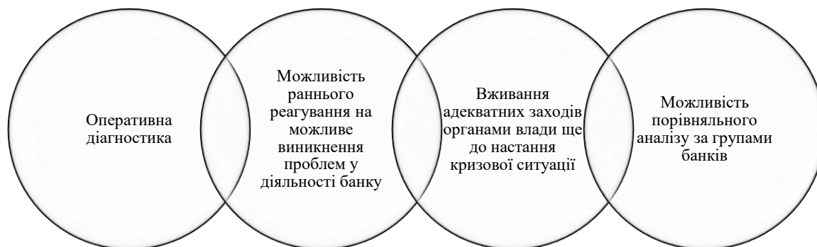
Рис. 2. Переваги безвізного банківського нагляду

Дослідивши точки зору різних науковців, нормативні акти та різні інформаційні джерела відносно безвізного банківського нагляду ми виокремили основні переваги даної форми проведення банківського нагляду (рис. 2).