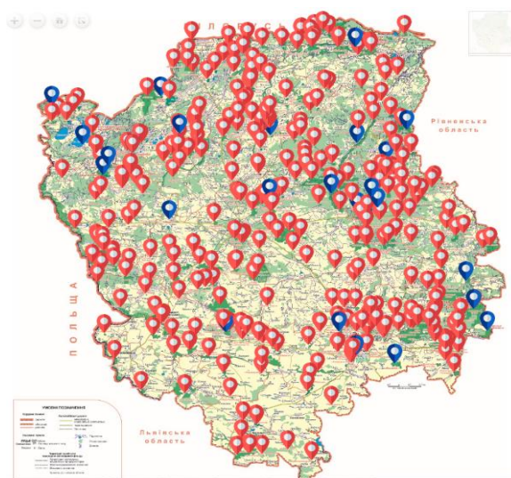
Рис. 2. Інтерактивна карта природно-заповідний фонд Волинської області [3]

Волинською обласною державною адміністрацією постійно вживаються заходи щодо розвитку природно-заповідної справи в області: відбувається погодження створення нових територій та об'єктів природно-заповідного фонду, розроблена Регіональна схема формування екологічної мережі Волинської області.