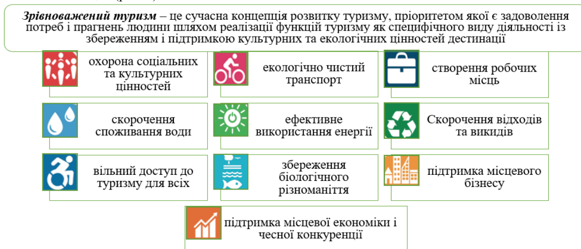
Рис. 1. Зрівноважений туризм і його цілі

Національною туристичною організацією України [2] ідентифіковано поняття «зрівноважений туризм» та визначено його основні цілі (рис. 1).