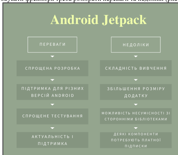
Рис. 1. Переваги та недоліки Android Jetpack

Перед тим як використовувати фреймворк треба розібрати переваги та недоліки (рис. 1).