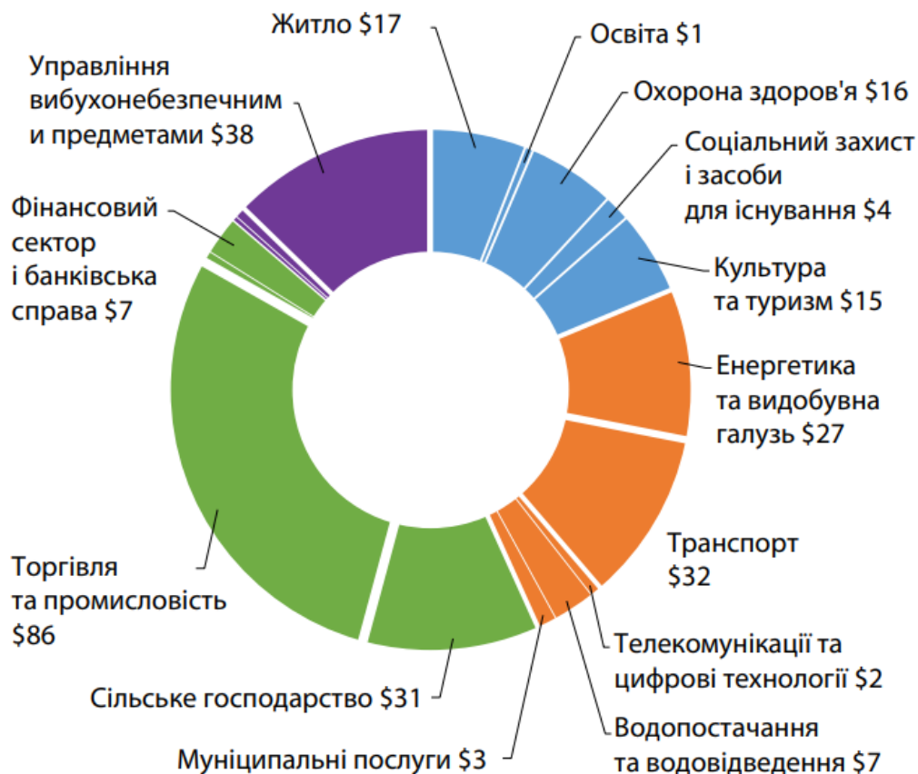
Рис. 3. Загальний обсяг завданих збитків (млрд дол. США)

Примітка: завдані збитки охоплюють період у 18 місяців після спливу 12 місяців з моменту початку вторгнення (з 24 лютого 2022 року до 24 лютого 2023 року). [2]