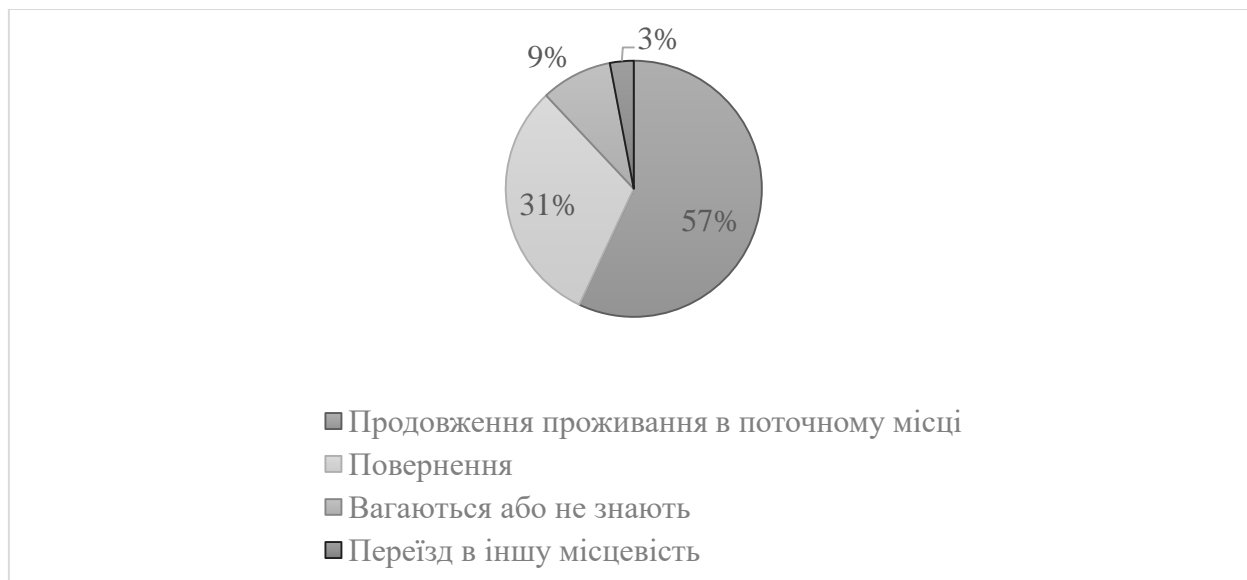
Рис. 1. Наміри ВПО щодо переміщення

За даними Міністерства соціальної політики України станом на 2024 рік кількість внутрішньо переміщених осіб становить 3,9 млн. З них – 3,6 млн – особи, які перемістилися (чи повторно перемістилися) після початку повномасштабної війни. З них – 2,5 млн, які перемістилися і не можуть повернутися до своїх домівок (оскільки житло або зруйноване, або знаходиться у зоні активних бойових дій, або на тимчасово окупованій території).